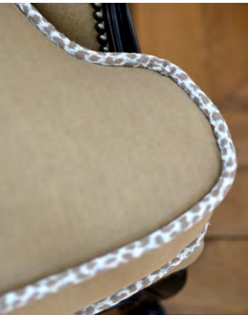
Passepoil col. 9610 et tissu Ilaya col. 9140.

BRAID COL. 9610, PALLADIO COL. 9135 & VALMONT COL. 9620 FRINGES.