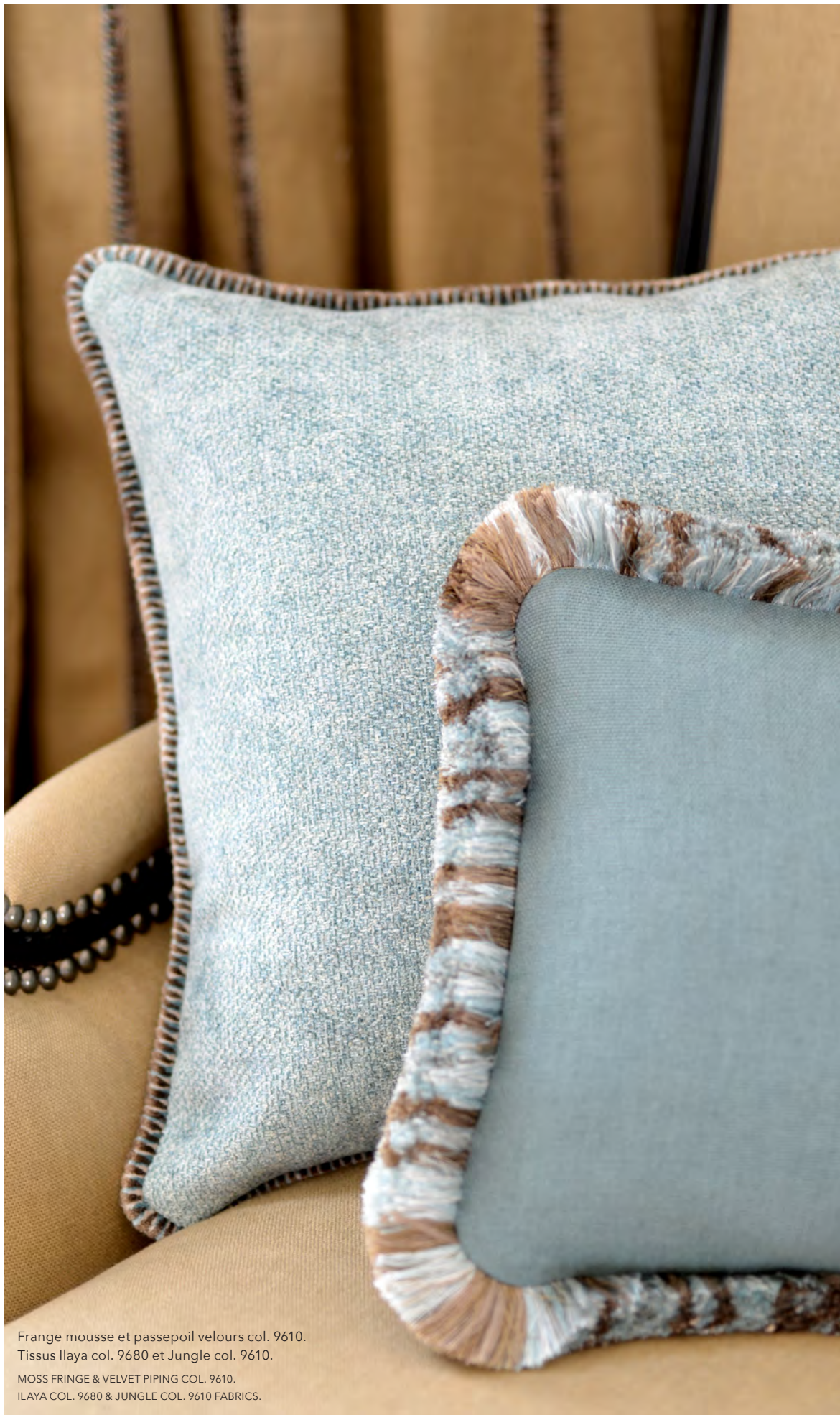
Frange mousse et passepoil velours col. 9610.

Tissus Ilaya col. 9680 et Jungle col. 9610.