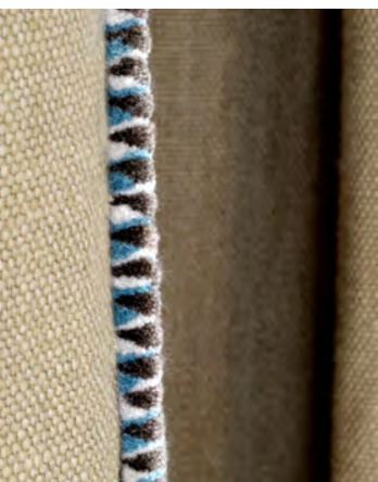
Passepoil velours col. 9610.

PIPING CORD COL. 9610 & ILAYA COL. 9140 FABRIC.