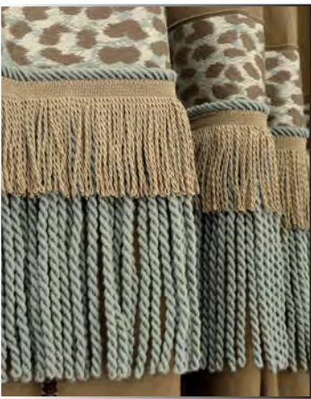
Galon col. 9610, franges Palladio col. 9135 et Valmont col. 9620.

BRAID COL. 9610, PALLADIO COL. 9135 & VALMONT COL. 9620 FRINGES.