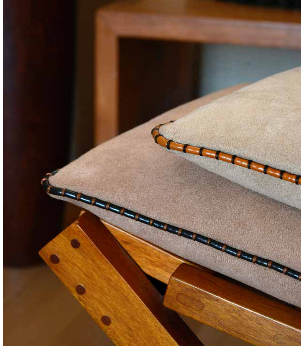
Passepoil surpiqué Stitched piping cord 31106 + col Diam. 5 mm - 3/16"