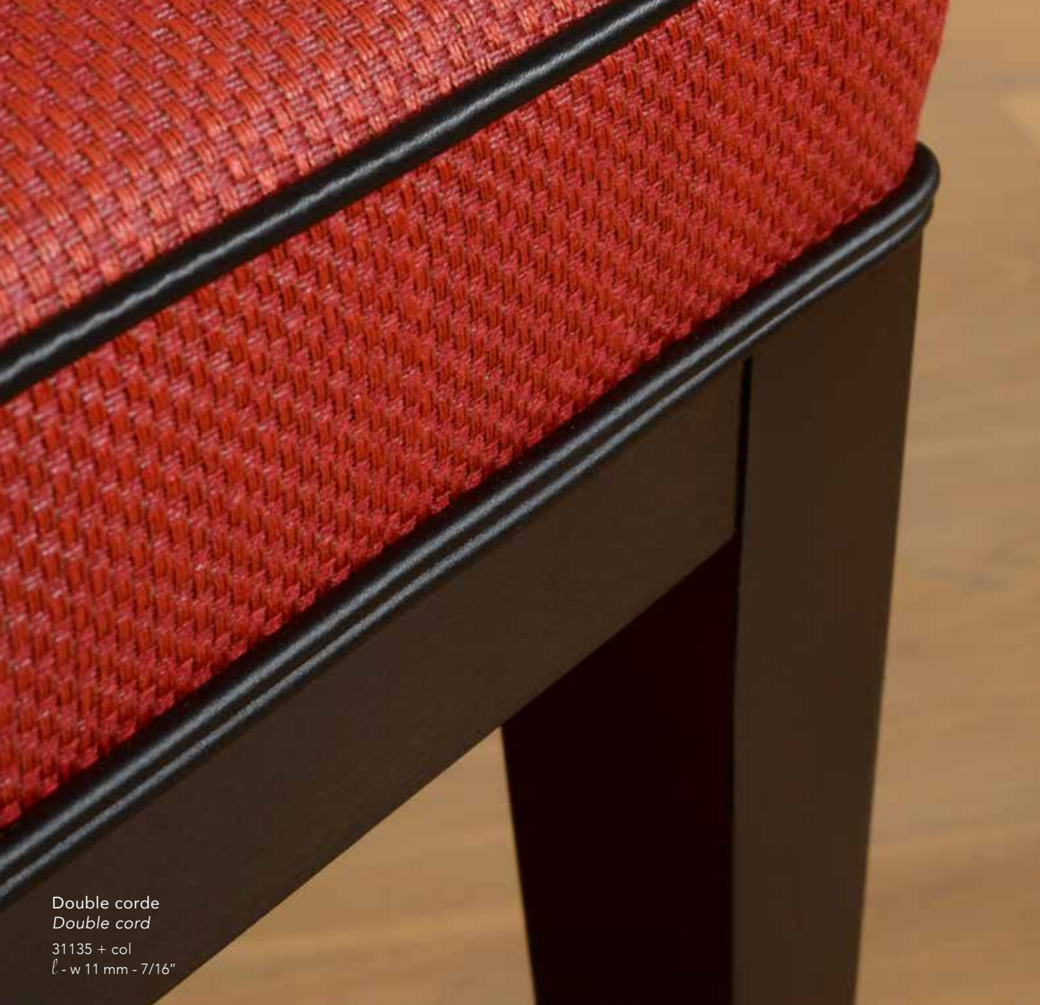
Double corde Double cord 31135 + col l - w 11 mm - 7/16"