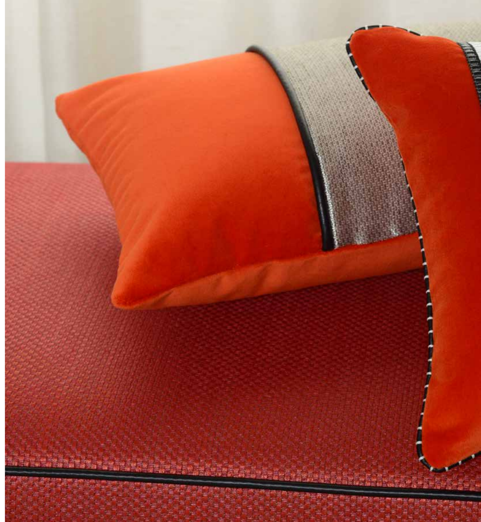
Passepoil Piping cord