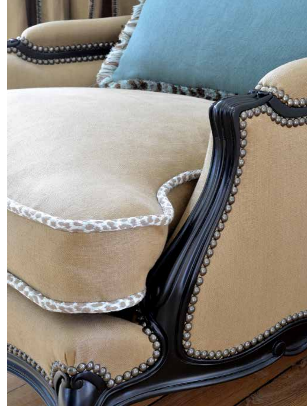
Frangse mousse Moss fringe 33330 + col H 40 mm - 1 9/16"