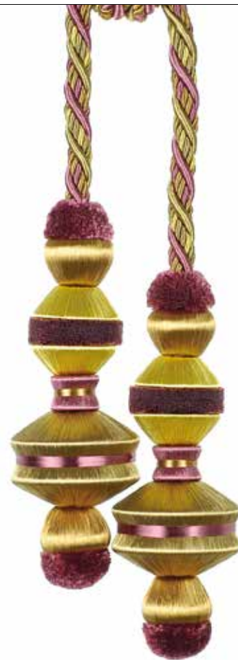
Embrasse 2 glands Double tassel tieback 35877 + col