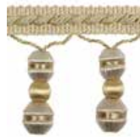
Taille réelle - Actual size