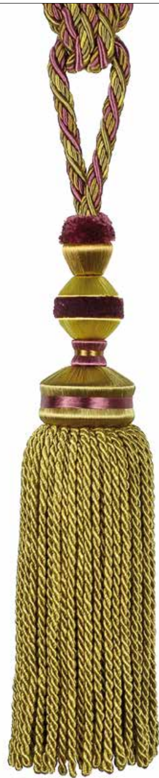
Embrasse 1 gland Tassel tieback 35705 + col