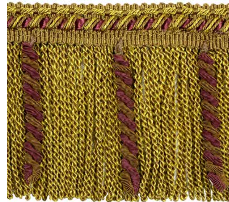
Frangé bouillons - Bullion fringe 33066 + col