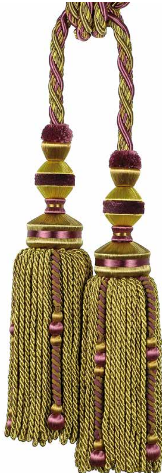
Embrasse 2 glands Double tassel tieback 35876 + col