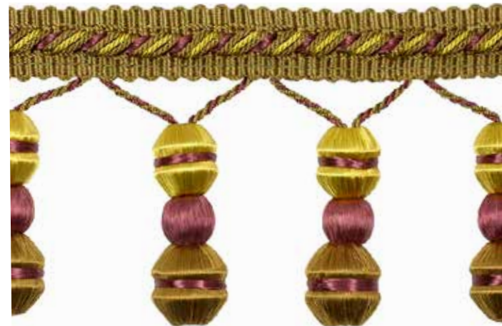
Frangé perles - Beaded fringe 33069 + col

H 60 mm - 2 3/8" 46%CV 30%WD 20%CO 4%PES