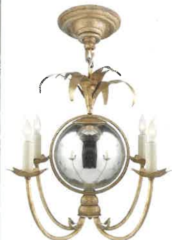
В проекте архитектор использовал бра Вapсі, а похожие мы нашли у E. F. Chapman.