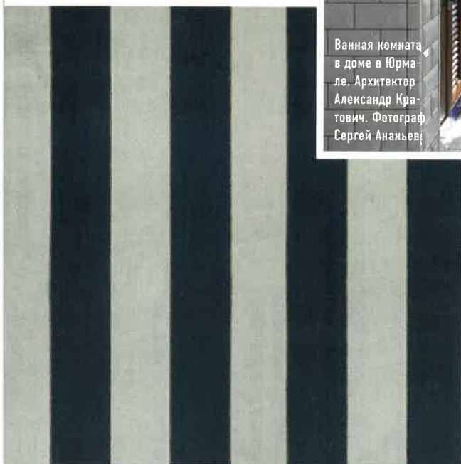
Штора сшита из ткани Gainsborough, похожая есть в коллекции Operetta, Galleria Arben.