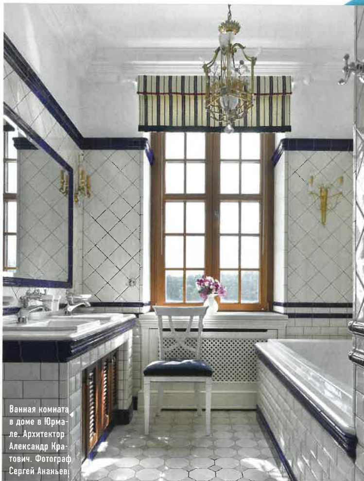
Ванная комната в доме в Юрмале. Архитектор Александр Кратович.

На обложке — гостевая ванная комната по проекту архитектора Александра Кратовича. Рассказываем, с помощью каких предметов и материалов создан этот интерьер.