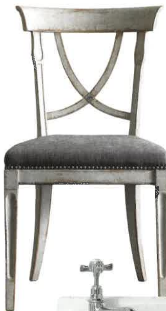
Полежал — теперь можно и посидеть. Именно поэтому в ванной нужен стул, например, от Vittorio Grifoni.