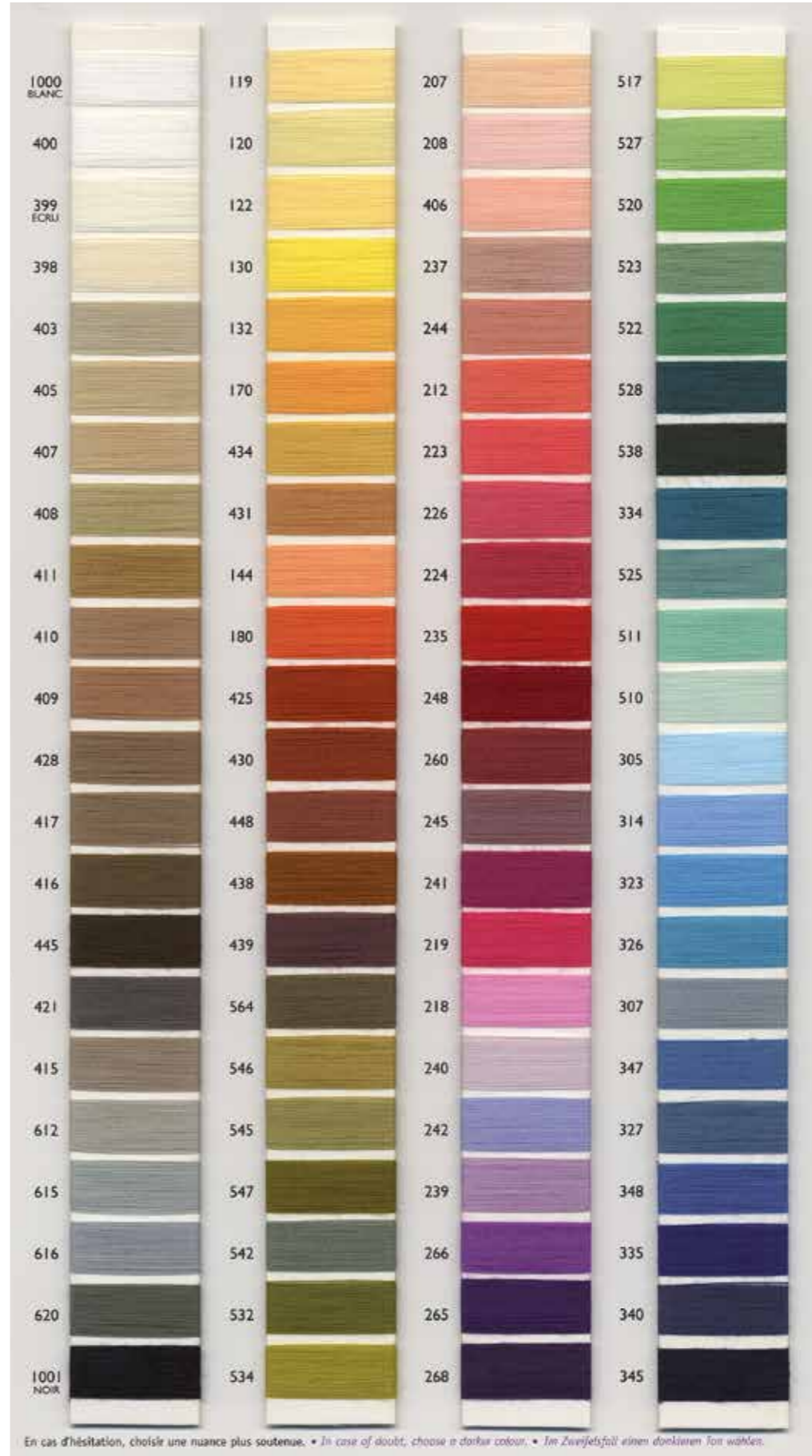
En cas d'hésitation, choisissez une nuance plus soutenue. • In case of doubt, choose a darker colour. • Im Zweifelsfall einen dunkleren Farb wählen.