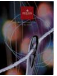
coll : 89211